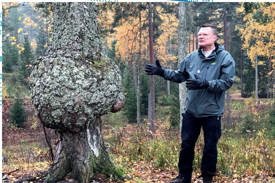
NurLan retkellä Sääksin ympäristössä.

ULA, eli Uudenmaan latualue järjestää neljä yhteistä tapahtumaa. Kuluvana vuonna on käytössä Tapahtumapassi, johon kerätään osallistumiskuitauksia. Kolmen tapahtuma suorituksen jälkeen passilla on mahdollista osallistua palkintojen arvontaan. Tapahtumia on seuraavasti: